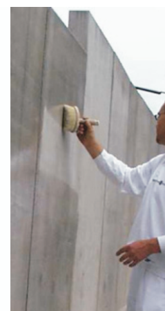
Po drugem nanosu je potrebno PAG s čopičem vtreti v površino