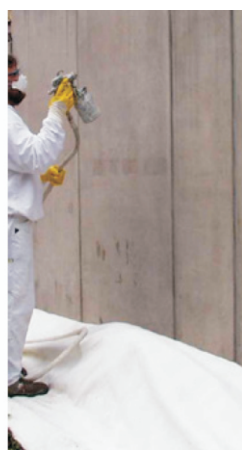
Pri drugem nanosu se izgled površine ne spremeni